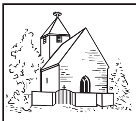
Evangelische Kirchengemeinde Bodelshofen