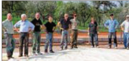
Ein Teil der Mannschaft

Eine weitere gute Nachricht: unsere Plätze werden vermutlich schon an den Osterfeiertagen bespielbar sein, denn die Platz-Instandsetzung ging problemlos am letzten Freitag über die Bühne. Das bedeutet eine um mehrere Wochen verlängerte Saison. Bitte beachten: die offizielle Platzfreigabe erfolgt per Rundmail!