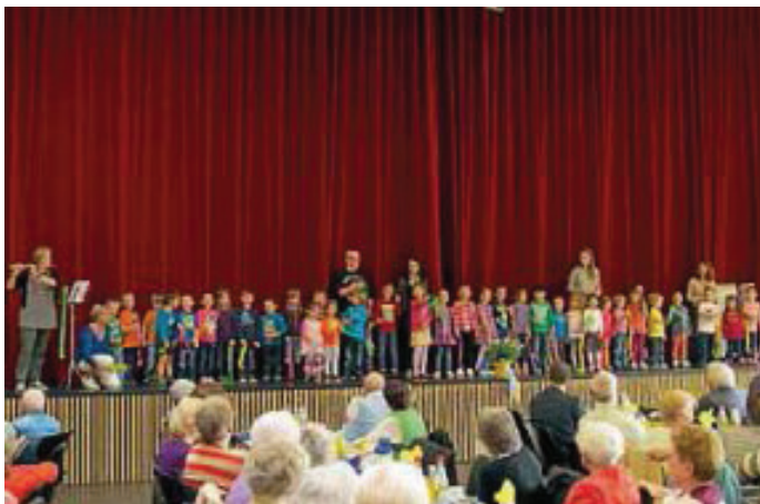
Der Kindergarten Stadtmitte stimmte mit bunten Frühlingsliedern in den fröhlichen Nachmittag ein. Lautstark sangen sich die Kinder dabei in die Herzen der Zuschauer.