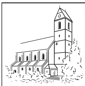
Katholische Kirchengemeinde St. Kolumban