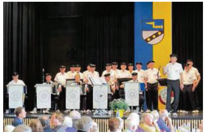
Im Anschluss traten die Neckar-Knurrhähne auf. Mit Shantys wie „Über uns der blaue Himmel“, „Auf der Insel Helgoland“ und „I am sailing“ sorgten sie für ausgelassene Stimmung.