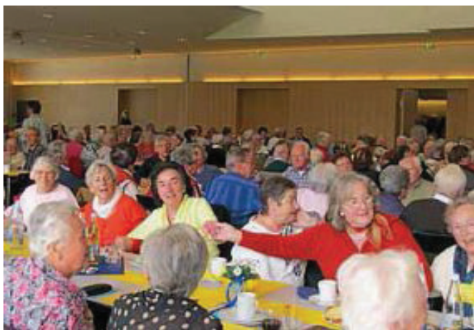
Bei dem ein oder anderen Seemannslied des Shanty-Chors aus Neckarhausen wurde kräftig mitgesungen und mitgeschunkelt.