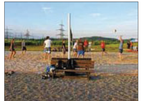
Beach-Volleyball Training auf dem Vereinsgelände

Ab sofort steht aber auch wieder die Halle montags und donnerstags für das Badminton-Training zur Verfügung.