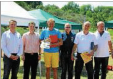
Fotos vom Turnier sind auf der Homepage des TCW abrufbar ( www.tc-wendlingen.de )

Der Wendlinger Tennisclub freute sich insbesondere auch darüber, dass sich unser Bürgermeister Steffen Weigel die Zeit nahm, den Spielen am Finaltag beizuwohnen und es sich nicht nehmen ließ, den Ehrenpreis der Stadt Wendlingen dem Sieger bei den Herren 60 persönlich zu überreichen.