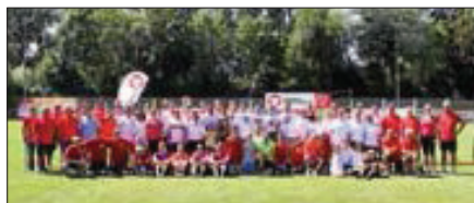
Teilnehmer am 1. Unterboihinger Sommerbiathlon

Ein besonderer Dank gilt an dieser Stelle auch allen Sponsoren, Gönnern und Helfern, ohne die diese gelungene Veranstaltung nicht möglich gewesen wäre. Weitere Informationen und Bilder unter www.tvu-unterboihingen.de