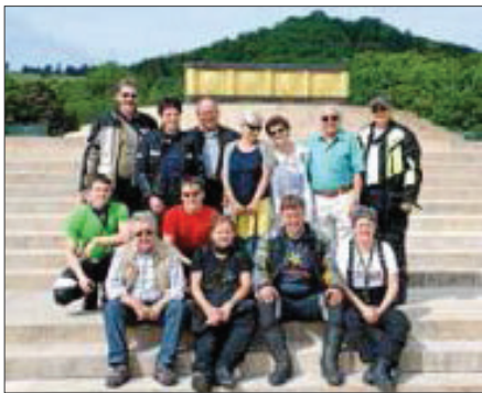
Die Mitglieder vor dem Nationaldenkmal "Hartmannswillerkopf" in den Vogesen