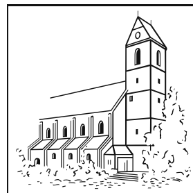
Katholische Kirchengemeinde St. Kolumban