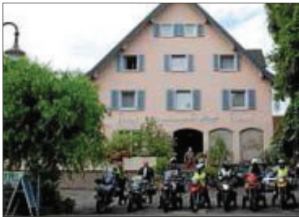
Die Mitglieder vor dem Hotel in Breisach

schwarzwald über Schramberg nach Sulz am Neckar. Nach einer gemeinsamen Kaffeepause am Neckar führen wir weiter den Neckar entlang über Rottenburg und Tübingen nach Nürtingen. Dort beendeten wir unsere sehr schöne Vogesen/Schwarzwaldtour mit einem gemeinsamen Abendessen im Gasthaus „Schlachthof“. Alle Teilnehmer sind unfallfrei und pannenfrei wieder gut zu Hause angekommen und freuen sich schon heute auf unsere nächste gemeinsame Drei-Tages-Ausfahrt Ende August an den Bodensee.