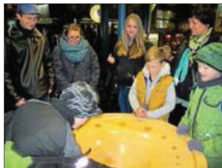
Im Planetarium von Stuttgart

Am 28.12.2013 reiste eine Gruppe Kinder und Jugendliche ins Planetarium nach Stuttgart, zur Lasershow „When stars dream“.