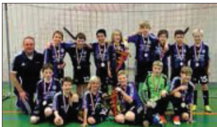
TSV Wendlingen 1 und 2

Am Samstag trafen sich beim sehr gut organisierten Turnier in Unterboihingen die besten 10 Teams von über 70 gestarteten Mannschaften zum Kreismeistertfinale.