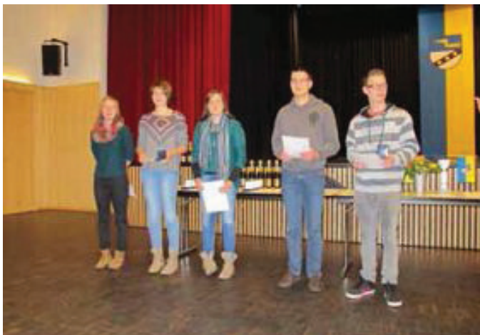
Musikerinnen und Musiker des Musikverein Wendlingen wurden für Erfolge bei den D2-, bzw. D3-Lehrgängen geehrt.