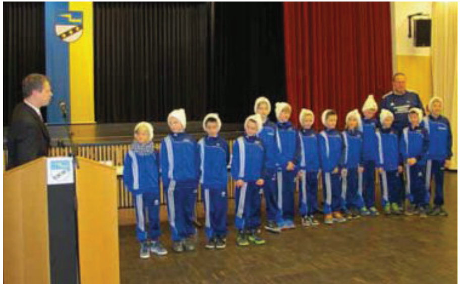
Die Jugendfußballer des TSV Wendlingen am Neckar feierten 2013 in der E-Jugend den Meistertitel in der Kreisstaffel 13 und mit der D-Jugend Staffelsieger Herbst 2013 Kreisstaffel 12.