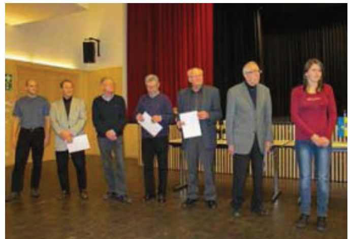
Für die Ablegung des Sportabzeichens zum 10., 20., 25., 30. und sogar 40. Mal gab es ebenfalls eine Auszeichnung.