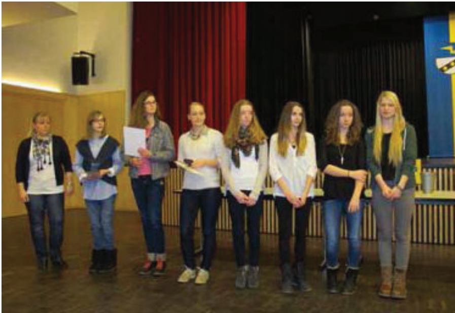
Die Rope Skipper des TV Unterboihingen wurden für ihre zahlreichen Erfolge und Meistertitel im vergangenen Jahr geehrt.