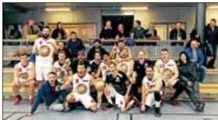
Wir freuen uns auf eine spannende Landesliga Saison Ende September.

wieder. So stand es vor dem letzten Viertel 35:36. Doch endlich zeigten die Bullets Kampfgeist und machten klar, dass sie sich so kurz vor dem Ziel nicht mehr stoppen lassen würde. In der Verteidigung lies man nichts mehr zu und im Angriff überrollte man Albershausen mit schnellen Angriffen. Zum Schluss konnte man das Spiel mit 43:63 gewinnen und ausgelassen den zweiten Aufstieg in Folge feiern. Ein großer Dank geht an die zahlreichen Fans, welche den Basketballsport in Wendlingen zu einer so schönen Sache machen und die Mannschaft Spiel für Spiel nach vorne treiben.