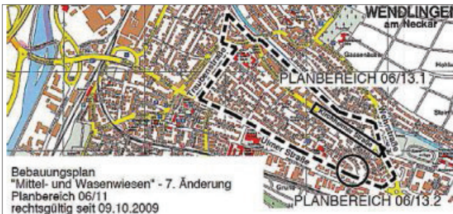
Kartografie: © Stadt-Verlag E. v. Wagner & J. Mischke/Beitrag - 70705 Fellbach

Der Gemeinderat der Stadt Wendlingen am Neckar hat in der öffentlichen Sitzung am 16.12.2014 unter Einbeziehung der vorgetragenen Anregungen sowie nach der Abwägung gemäß § 1 Abs. 7 BauGB, den vorstehenden aufgeführten Bebauungsplan mit den Textlichen Festsetzungen jeweils in der