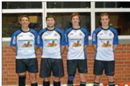
Radball Oberliga RSV Wendlingen

In Oberesslingen gelang es den beiden Oberliga-Mannschaften ihre derzeitige Erfolgsserie fortzusetzen. Die Teams gingen ohne Niederlage mit jeweils sieben Punkten aus dem 4. Spieltag. Wendlingen 1 Frank/Kevin überzeugten mit 5:1 gegen Denkendorf 4, 4:4 gegen Oberesslingen 4 und 5:1 gegen Oberesslingen 3. Damit erreichten sie den 2. Tabellenplatz direkt hinter Wendlingen 2 Dennis/Kevin, die nach wie vor die Tabellenführung mit 4:4 gegen Oberesslingen 4, 4:0 gegen Oberesslingen 3 und 5:0 gegen Denkendorf 3 verteidigen konnten.