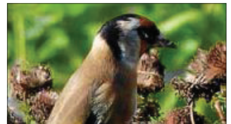
Distelfink: Foto A. Gärtner

Am Sonntag, 11.1. wollen wir mit allen Interessierten aus den beiden Gemeinden eine Führung zu unseren gefiederten Wintergästen unternehmen. Wer weiß noch welche Vögel bei uns überwintern und welche uns verlassen? Wir wollen gemeinsam mit Ihnen dieser Frage nachgehen. Interessiert? Kommen Sie doch mit. Treffpunkt um 13.30 Uhr am Friedhof in Köngen.