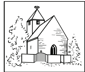
Evangelische Kirchengemeinde Bodelshofen