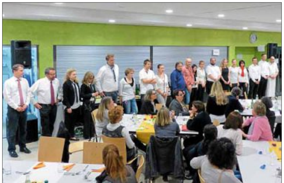
Das Helferteam mit Bürgermeister Steffen Weigel sowie den Lehrerinnen und Lehrern des Robert-Bosch-Gymnasiums

Zwischen den Gängen wurden die Eltern von der orientalischen Tanzgruppe „Die tanzenden Diamanten“ mit rhythmischen Tänzen verzaubert.