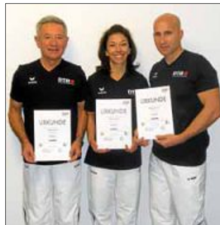
Trainer im Gesundheitssport

Durch diese Qualifizierung können über die Krankenkassen zum Teil oder sogar die ganze Kursgebühr wieder zurückerstattet werden.