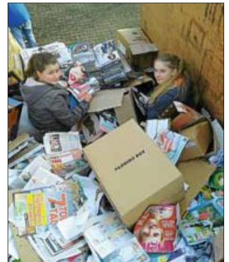
Helfer im Container

Weitere Informationen finden Sie auf unserer Homepage unter: www.wendlingen.dlrg.de/angebot/altpapierbringensammlungen