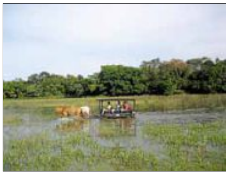
Pantanal Brasilien

Am 27.11. wollen wir mit unserem Familienabend das Jahr 2015 ausklingen lassen. Wir treffen uns im Albvereinsheim in Köngen um 20 Uhr. Bei einem deftigen Abendbrot und Getränk, stets gut bewirtet von Mitgliedern des AV, und guten Gesprächen werden wir dann einen Reisebericht über das größte Sumpfbereich der Welt, dem Pantanal in Brasilien, vorgetragen bekommen. Natürlich ist auch eine Dia-Show über den „Größten Zoo Amerikas“ wie das Pantanal auch genannt wird, vorbereitet. Lassen Sie sich überraschen und freuen Sie sich auf einen unterhaltsamen Abend. Alle Mitglieder und Interessierten sind herzlich willkommen.