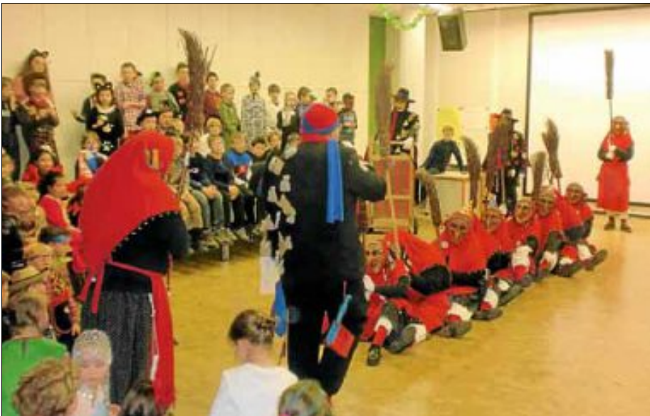
Die Nelauhexen beim Trockenrudern mit dem Besen.