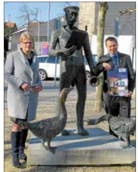
Oberbürgermeister Angelika Matt-Heidecker aus Kirchheim/Teck und Bürgermeister Steffen Weigel stellten die Veranstaltungsreihe "Kultur an besonderen Orten" vor.

Die Mitglieder des Verkehrsvereins Teck-Neuffen und die Veranstalter wünschen Ihnen viel Freude bei den unterschiedlichen Kulturveranstaltungen inmitten einer der schönsten Gegenden des Landes Baden-Württemberg.