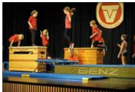
Die jüngsten Turnerinnen des TVU in Aktion

Eine beeindruckende Jahresfeier erlebten die Besucher vergangenen Freitag im Treffpunkt Stadtmitte.