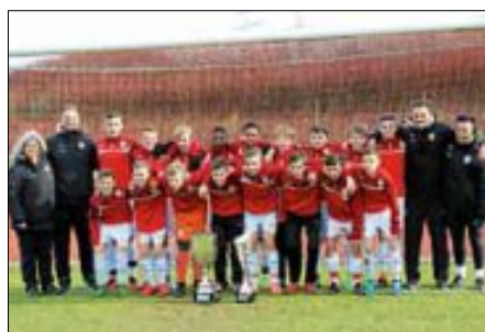
REWE Cup Sieger 2016 VfB Stuttgart