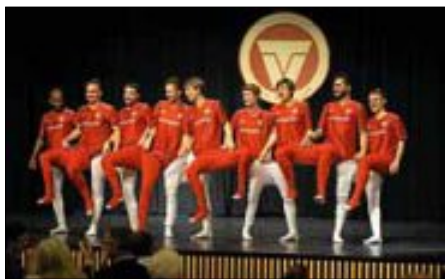
Das "Fußballett" der Rot-Weißen