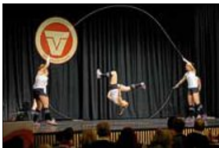
Die Rope-Skipperinnen begeisterten mit einer spektakulären Show