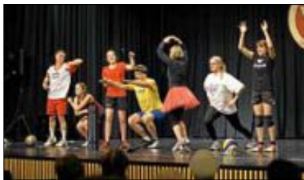
Die Volleyballer des TVU parodierten die Vereinssportarten