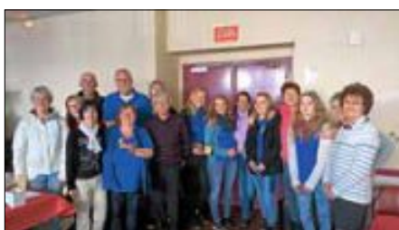
Zu Gast beim Partnerschaftskomitee

Zurück im Schwimmbad, gab es zunächst die Synchronschwimmer zu bestaunen, bevor französische Schwimmer unter Anleitung von DLRGlern einen kleinen Rettungswettkampf austrugen. Danach galt es in Mannschaften innerhalb einer Stunde möglichst viel Strecke für das Spendenkonto von UNICEF