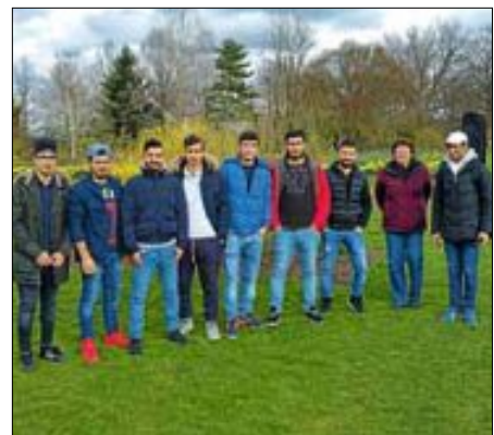
Syrische und Irakische Flüchtlinge besuchen an Ostern den Tachenhäuser Hof

Internet: www.arbeitskreis-asyl-wendlingen.de facebook: https://www.facebook.com/AKAsylWendlingen