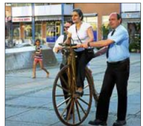
Mit fachmännischer Unterstützung klappt die Fahrt.

Im Rahmen des gegenseitigen Besuchsprogrammes kam wieder eine Gruppe von Bürgern aus Saint-Leu-la-Forêt nach Wendlingen am Neckar. Stationen der Anreise waren diesmal Schwetzingen, Heidelberg, Bad Wimpfen und Schwäbisch Hall, bevor der Bus am Freitagabend nach Himmelfahrt am Wendlinger Rathaus eintraf, wo die Gäste von ihren Gastgebern empfangen wurden. Der Abend in den Familien wurde genutzt, um Erinnerungen auszutauschen; die zum ersten Mal nach Wendlingen am Neckar gekommenen Gäste lernten gleich die schwäbische Gastfreundschaft kennen.