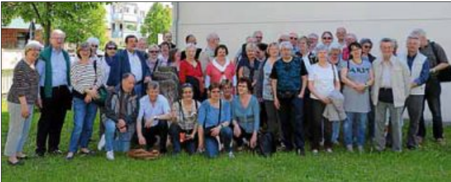
Partnerschaftskomitee Millstatt am See

Voller positiver Eindrücke starteten die französischen Gäste danach mit der Bahn in Richtung Heimat. Au revoir - auf Wiedersehen im nächsten Jahr in Saint-Leu-la-Forêt!