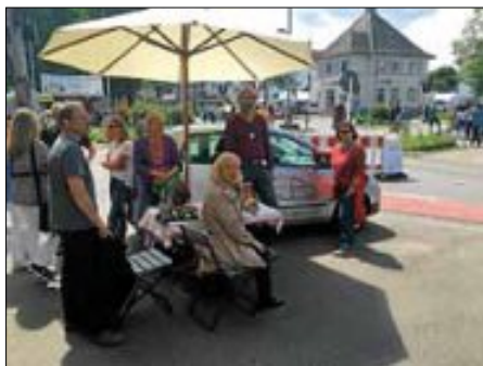
Der Infostand auf dem City Fest

Auch in diesem Jahr war der Verein Ökologie und Mobilität Wendlingen e.V. auf dem Cityfest vertreten. Bei sehr angenehmem und trockenem Wetter präsentierte der Verein das von ihm in Wendlingen betriebene Car Sharing Modell.