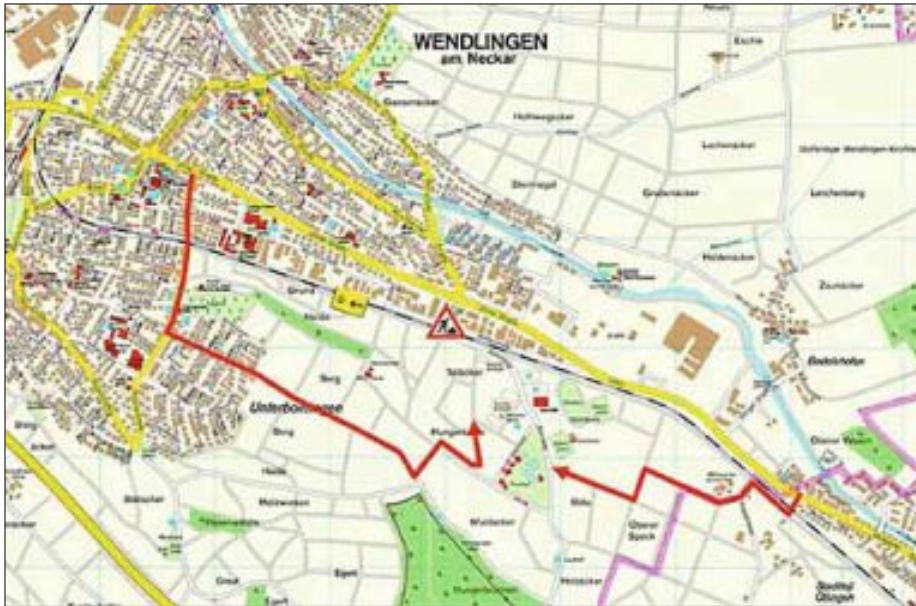
Arbeiten am Bahnübergang Speckweg - Zufahrten im Notfall

Nach 22.30 Uhr abfahrende Fahrzeuge werden über den Feldweg entlang der Bahnlinie umgeleitet. Grund für die Sperrung sind Gleisbetsanierungen im Zuge der S-Bahnstrecke Wendlingen am Neckar – Kirchheim unter Teck der DB Netze.