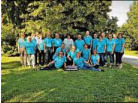
Das Orchester im Schlossgut Köngen

musizieren. Die Zuhörer fanden einen schönen Platz im Schatten, die Musik hat gefallen und auch das Vesper fand reißenden Absatz. Ein sehr schöner Platz...gerne kommen die Musiker des Wendlinger Akkordeonorchesters wieder.