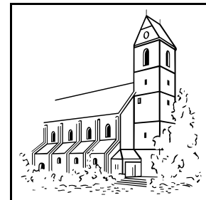
Kirche St. Kolumban

Freitag, 12.08., Johanna Franziska von Chantal 15 Uhr Eucharistiefeier in der Dreifaltigkeitskirche.