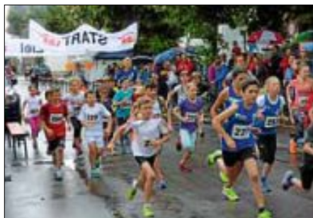
Start des Schülerlaufes

Vergangenen Freitag fand der 11. Wendlinger Zeitungslauf in der Innenstadt statt. Bei leichtem Regen wurde gegen 18.30 der Schülerlauf gestartet und um 19 Uhr wurden die Erwachsenen auf die 4 schnellen Runden mit jeweils 2,5 km geschickt. Die LA-Abteilung des TSV hatte die sportliche Organisation und die Abt. Tischtennis sorgte für das leibliche Wohl. Der TSV Wendlingen bedankt sich bei allen Sportlerinnen und Sportlern sowie bei den Sponsoren und Gästen.