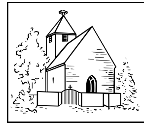
Evangelische Kirchengemeinde Bodelshofen

statt. Die Proben in der Lauterschule beginnen wieder ab dem 12.9.! Wir wünschen allen Sängerinnen und Sängern sowie allen Musikern schöne und vor allem erholsame Ferien!