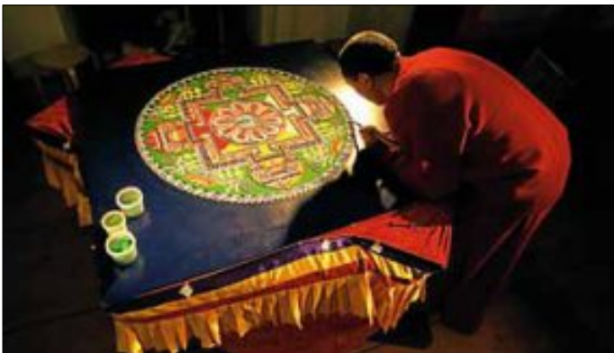
Ein Sandmandala entsteht.

in seiner ursprünglichen Form praktiziert wird. Für Eltern mit Kindern unter 3 Jahren bietet MiT in Zusammenarbeit mit dem Landkreis dienstags das ProJuFa-Frühstück an. Freitags finden Filzurse für Schulkinder statt. Alle unsere Veranstaltungen finden Sie ausführlich beschrieben im gelben Programmheft.