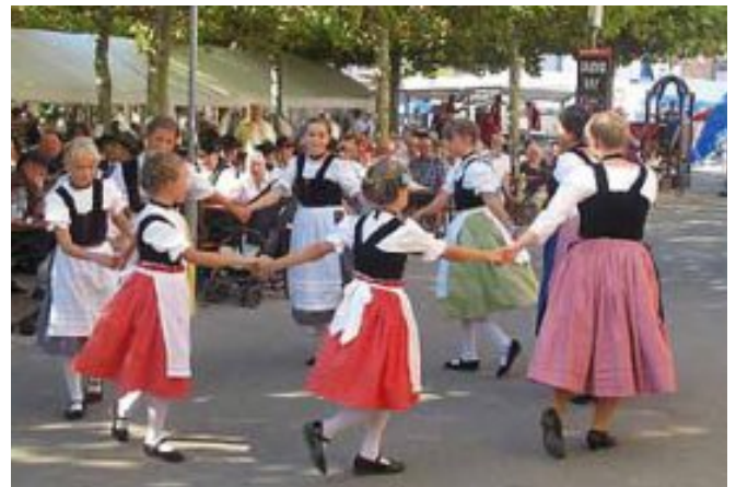
Bei der Feierlichen Eröffnung vor dem Rathaus führten u.a. die Trachtengruppe des Südwestdeutschen Gauverbands der Heimat- und Trachtenvereine und die Kindergruppe der Banater Schwaben ihre Tänze vor.