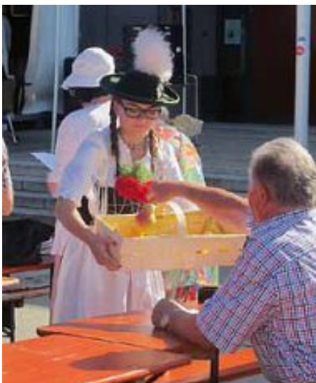
Traditionell am Birnsonntag wurden nach dem Gottesdienst Birnen an die Festgäste verteilt.