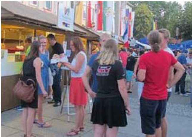
Insgesamt 22 Vereine, darunter auch die drei Partnerstädte, sorgten an beiden Tagen für ein vielfältiges Bewirtungsangebot.