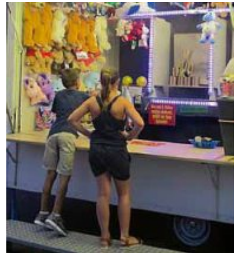
Für die kleinen Festgäste gab es am Wochenende einen Vergnügungspark in der Albstraße.