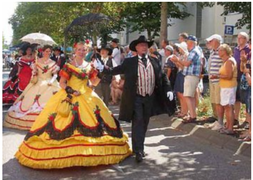
Beim Ernte- und Trachtenfestumzug am Sonntagmittag konnten die Festbesucher vom Straßenrand aus 30 ganz unterschiedliche Gruppen in teils sehr aufwändigen Trachten und Kleidern bestaunen.