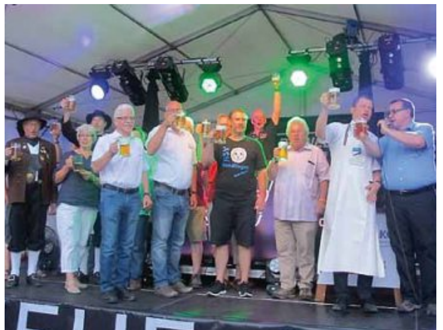
Nach nur wenigen Schlägen hieß es „Ozapft is“. Vertreter der mitwirkenden Vereine und die Organisatoren freuten sich über die kühle Erfrischung.