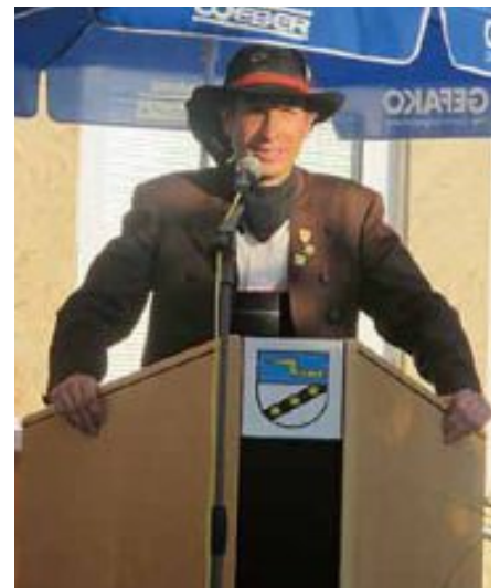
Der neue Vorsteher der Egerländer Gmoin Wendlingen e.V. begrüßte die Festgäste und bedankte sich bei allen Mitwirkenden.