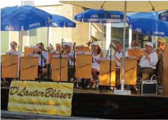
Musikalisch umrahmt wurde die Eröffnung des 65. Vinzenzfestes und des 42. Egerländer Landestreffens durch D'LauterBläser.