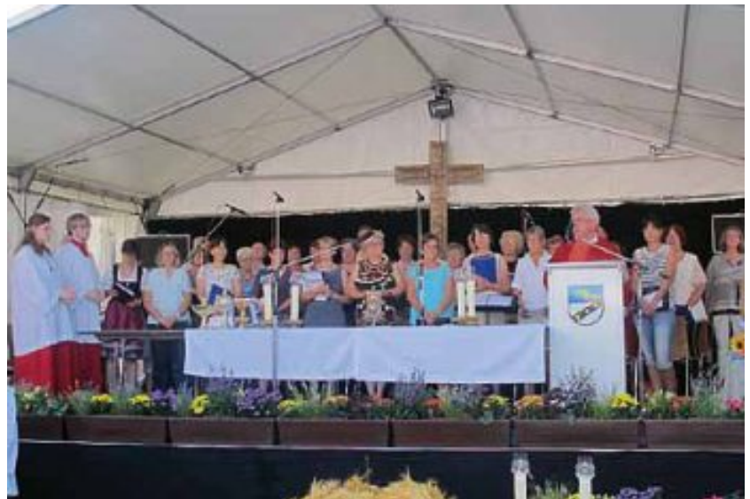
Im Anschluss folgte der Festgottesdienst auf dem Marktplatz, bei dem auch der Kirchenchor St. Kolumban und der Musikverein Unterboihingen mitwirkten.