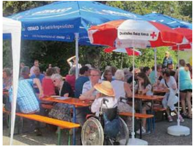
Bei den hochsommerlichen Temperaturen suchten viele Festgäste ein schattiges Plätzchen unter den Platanen auf dem Saint-Leu-la-Forêt Platz oder beim Bewirtungsstand des DRK an der Lauterschule.