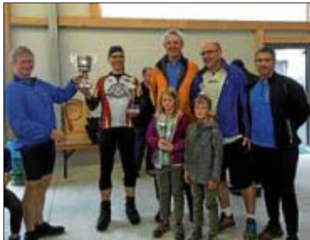
Siegerehrung Kreiswanderpokal 2016