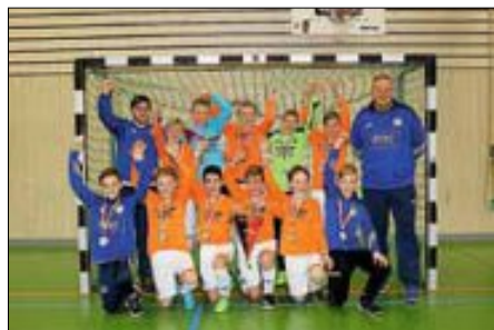
Die D1-Junioren des TSV Wendlingen

Die D1 Junioren des TSV Wendlingen konnten ihren Hallenkreismeistertitel vom letzten Jahr verteidigen. Nachdem es im letzten Jahr als Jahrgangsjüngere sehr überraschend war, wurde man dieses Jahr seiner Favoritenrolle gerecht. Gratulation an die Mannschaft!