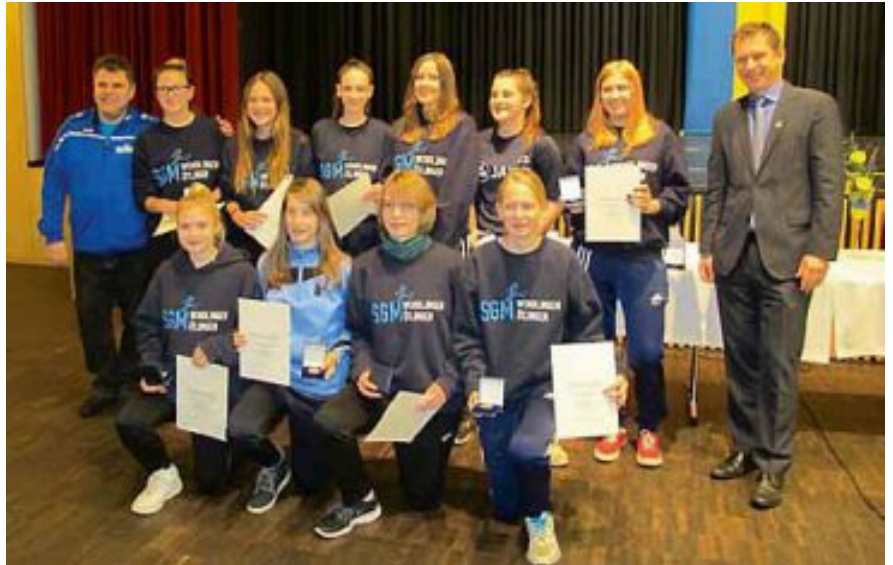
Die C-Juniorinnen der Spielgemeinschaft TSV Wendlingen – TSV Ötlingen wurden im letzten Jahr Bezirksmeister und Pokalsieger im Freien, Bezirksmeister in der Halle und erreichten den 6. Platz bei den Württembergischen Hallenmeisterschaften.

Zur Einstimmung zeigten zwei junge Sportler des Radsportvereins Wendlingen e.V. ihr Können auf dem Kunst- rad.