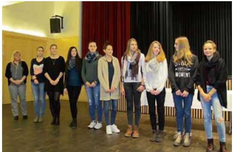
Auch die Rope-Skipperinnen des TV Unterboihingen durften zum wiederholten Male die begehrten Medaillen und Urkunden der Stadt Wendlingen am Neckar für Ihre Leistungen im vergangenen Jahr mitnehmen.