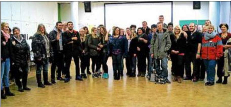
Modulabschluss Winter 2015 mit einigen aktuellen Modulleitern

Ein reger Schüleraustausch mit Partnerschulen in Frankreich, Großbritannien und Spanien geben Schülerinnen und Schülern des Robert-Bosch-Gymnasiums die Möglichkeit, mit Jugendlichen anderer Länder Kontakt zu pflegen und deren Sprache zu üben. Das Robert-Bosch-Gymnasium deckt die Abschlüsse des allgemeinbildenden Schulwesens bis zum Abitur – das zum