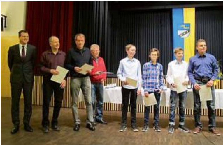
Auch die Spieler vom Tennisclub Wendlingen waren im vergangenen Jahr sehr erfolgreich und erreichten bei den Württembergischen Meisterschaften die vorderen Plätze.