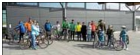
Die Gruppe vor der Sporthalle Im Speck

Am Samstag, 25.3. fanden sich 15 Radler und 3 Trainer bei Sonnenschein, böigem Wind und noch frischen Temperaturen um 9.30 Uhr an der Sporthalle Im Speck ein, um an dem zum 2. Mal stattfindenden Fahrrad-Sicherheitstraining teilzunehmen. Nach kurzer Erklärung der richtigen Sattelhöhe und Cockpiteinstellung ging es los. Zuerst stand lockeres Einfahren mit Abklatschen beim Begegnen auf dem Programm. Danach wurden Koordination und Gleichgewichtssinn gefragt beim Kreise- und 8er-Fahren sowie beim Durchfahren zweier eng nebeneinander liegenden Seile (auf 30 m Länge) und einem Slalom-Parcours. Beides wurde durch mehrmaliges Verändern der Abstände erschwert. Nach einer kurzen Stärkung ging es dann weiter mit Bremsen. Geübt wurde das Bremsen mit der Hinterradbremse, der Vorderradbremse und mit beiden Bremsen gleichzeitig, dabei wird der kürzestmögliche Bremsweg erzielt. Zuletzt wurde noch das Schalten und Anfahren am Berg erklärt und durch entsprechende Übungen in die Praxis umgesetzt. Nach Ende des Trainings traf man sich noch auf einen Kaffee in der Sporthalle Im Speck, wo die Radballer des RSV ein Heimspiel hatten.