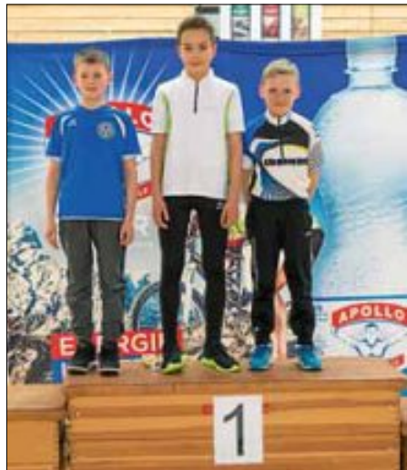
Die 3 Erstplatzierten bei den Schülern U13

eine Kür ohne Bodenberührung auch wenn er einige Male sehr darum kämpfen musste. Mit ebenfalls neuer Bestleistung von 76,73 Punkten erreichte er einen sehr guten 2. Platz. Am 30.4. geht es für die Wendlinger Kunstradsportler mit der Bezirksmeisterschaft in Pleidelsheim weiter.