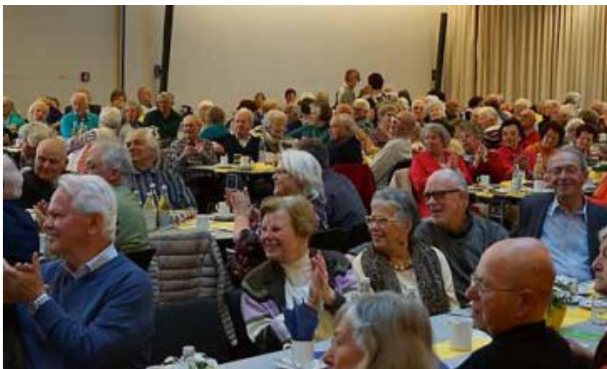
Die eingeladenen Seniorinnen und Senioren folgten gespannt dem Programm auf der Bühne und nutzten die Pausen zum Plaudern mit den Tischnachbarn.