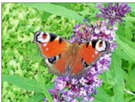
Tagpfauenauge