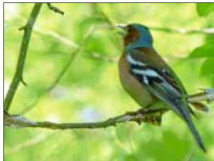
Buchfink