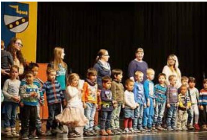
Mit fröhlichen Frühlingsliedern stimmten die Kinder des Kindergartens Stadtmitte in den vergnüglichen Nachmittag ein und animierten die Zuschauer gleich zum mitmachen.