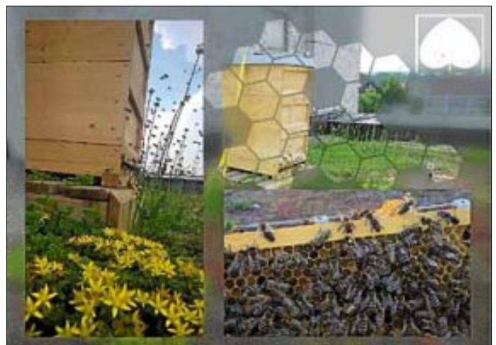
Das Bild zeigt die Bienenbeute auf dem Rathausflachdach.

Stadt Wendlingen am Neckar, möchte die Stadt Wendlingen am Neckar mit der Aktion auf die große Bedeutung von Honigbienen aufmerksam machen. Nicht der Honig macht die Biene so unverzichtbar, sondern ihre Bestäubungsleistung. 80 Prozent der Obst-, Beeren-, und Gemüsepflanzen sind von einer erfolgreichen Bestäubung durch Honigbienen abhängig. Neben der hohen ökologischen Bedeutung wird der finanzielle Wert der Leistung von Honigbienen weltweit auf über 300 Milliarden € geschätzt. Keine Angst - hingegen zur Wespe ist die Biene ein friedliebendes Insekt