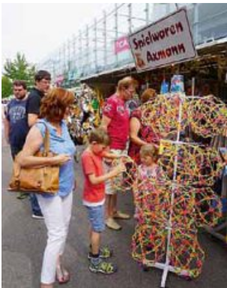
Beim Vinzenzmarkt gab es auch für die Kleinen etwas zu entdecken.