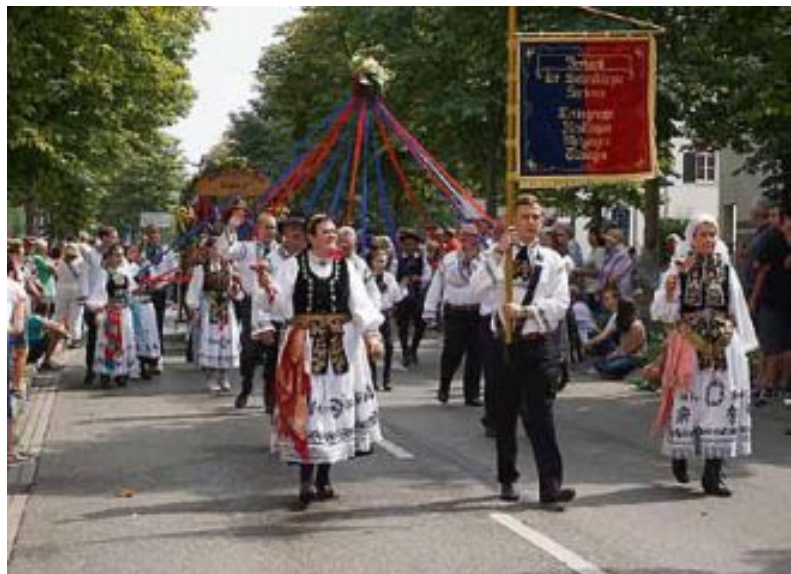
33 unterschiedliche Gruppen begeisterten die Zuschauer beim diesjährigen Ernte- und Trachtenfestumzug.