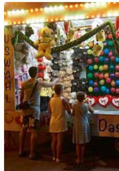
In der Albstraße war wieder ein kleiner Vergnügungspark aufgebaut.