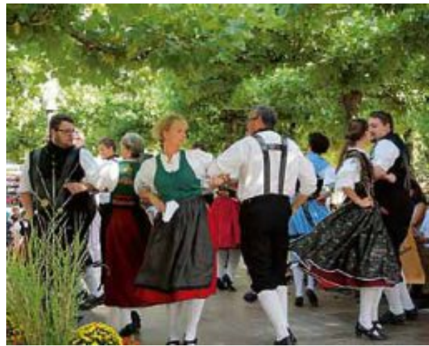
Bei der Eröffnung führten auch die Kindergruppe der Banater Schwaben und die Egerländer Gmoi ihre Tänze vor.