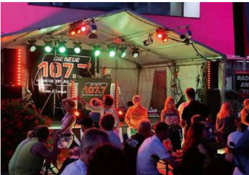
Bei der 107.7 Party brachte DJ Wolle die Leute mit einem gut abgestimmten Mix aus Rock und Pop zum Feiern und Tanzen.