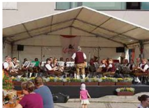
Zum Festausklang spielte in gewohnter Weise der Musikverein Wendlingen.

Viele weitere Fotos finden Sie auf www.wendlingen.de unter Stadt > Bildergalerie.