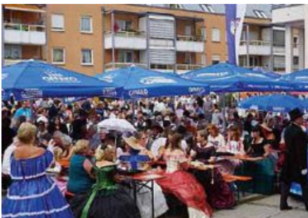
Im Anschluss an den Festumzug füllte sich der Marktplatz mit vielen bunten Trachten- und Kostümträgern.