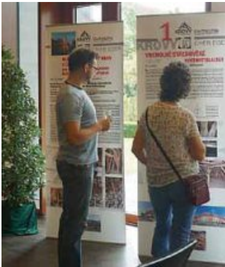
Anschließend konnte eine Ausstellung aus Eger besichtigt werden.