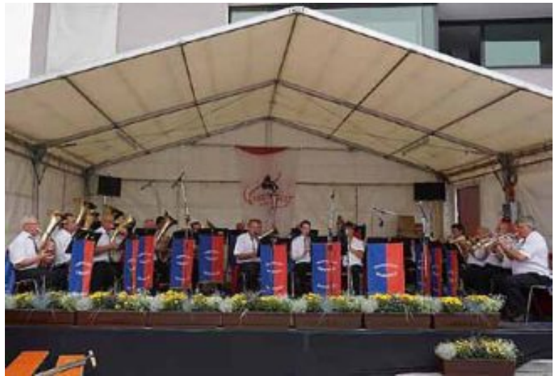
Am Nachmittag spielte die Siebenbürger Blaskapelle aus Schorn-dorf auf dem Marktplatz.