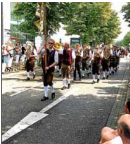
MV Wendlingen beim Festumzug