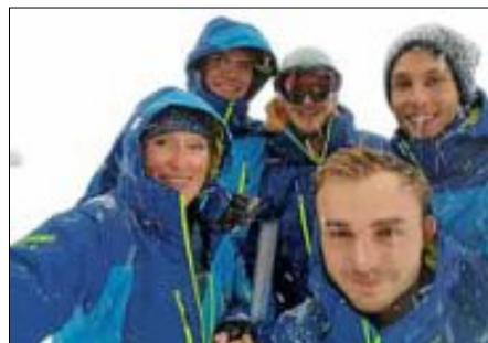
Ein Teil der Lehrkräfte im Schnee.

Manche standen in diesem Jahr zum ersten Mal wieder auf den Brettern, die die Winterwelt bedeuten, manche überhaupt das allererste Mal. Was für ein Erfolg für die Einsteiger, als sie bereits nach ein paar Stunden im Schnee Kurven in diesen ziehen konnten. Die fortgeschrittenen Fahrer genossen das Gelände des Skigebiets und ließen sich Tipps für eine sportlichere Fahrt und bessere Technik geben. Tiefschnee, Piste, Buckel - alles war an diesem Tag dabei. Unsere kleinen Gruppen ermöglichten wieder einen schnellen Fortschritt und die Teilnehmer hatten viel Spaß beim Lernen und Trainieren. Vielen Dank an alle Teilnehmer der Tagesausfahrt und Kurse, aber auch unseren Lehrkräften, die ihr Bestes gaben, dass alle den Erfolg hatten, den sie sich gewünscht hatten.