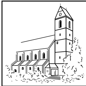
Kirche St. Kolumban

Katholische Kirchengemeinde St. Kolumban Wendlingen-Unterboihingen