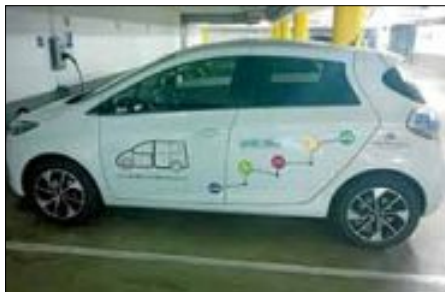
Unser elektrischer Zoe

Gerne informieren wir Sie auch im Detail zu unseren aktuellen Testwochen und den Einstieg in die E-Mobilität.