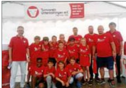
Die E1 - Junioren mit ihren Trainern wurden Meister der Kreisstaffel