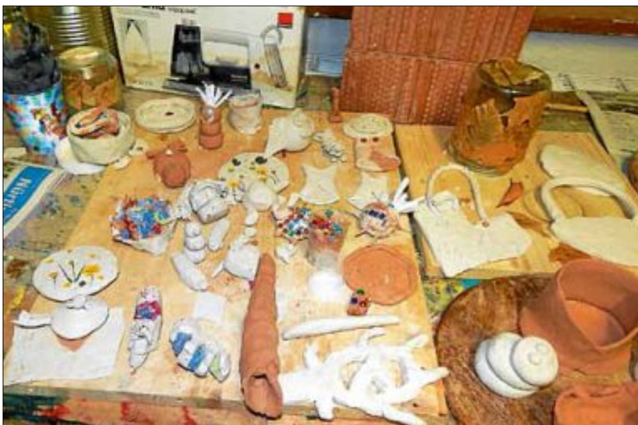
Übrig gebliebene Töpfersachen vom FiFeFo Pfingsten 2018.