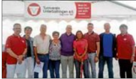
Die Mixed-Volleyballer des TVU wurden Meister der C-Klasse im Bezirk Ost des VLW