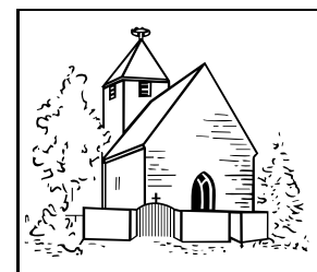
Evangelische Kirchengemeinde Bodelshofen