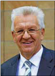
Winfried Kretschmann, MdL, Ministerpräsident des Landes Baden-Württemberg

Zum 67. Vinzenzifest und 44. Egerländer Landestreffen in Wendlingen am Neckar begrüße ich alle Besucherinnen und Besucher sehr herzlich!