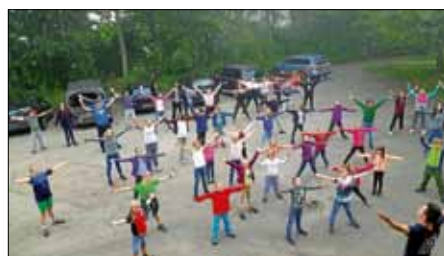
Jugendchor St. Koloman beim Frühstück

Der Eintritt ist frei. Spenden sind erbeten.