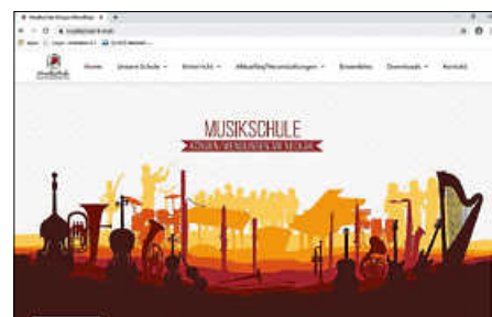
Neu gestaltet: die Website der Musikschule

Und noch eine gute Nachricht: Vor einigen Tagen sind unsere neue Internetseite www.musikschule-k-w.de und unsere Facebookseite Musikschule Köngen-Wendlingen online gegangen! Wir können nun noch kurzfristiger aktuelle Mitteilungen berichten, Infos über unseren Schulbetrieb bekanntgeben oder einfach nur wesentlich komfortabler und übersichtlicher über unser umfangreiches Angebot informieren. Wir freuen uns auf regen Besuch auf unseren beiden neuen Seiten und laden herzlich zur Interaktion ein!