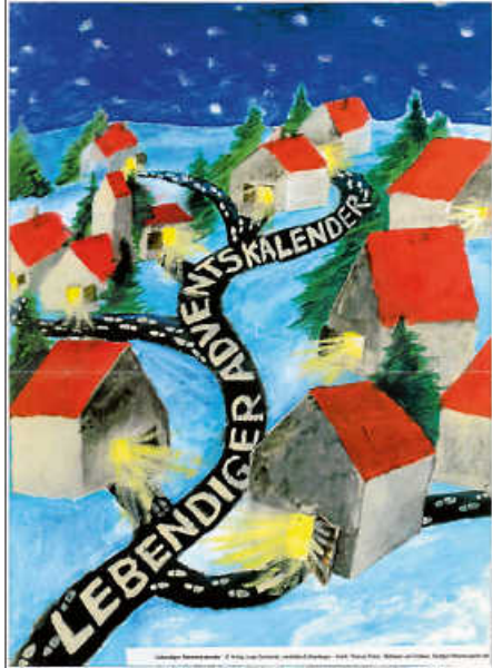
Plakat: Verlag Junge Gemeinde

Grundsätzlich kommen die Erlöse unserer Aktionen ausschließlich sozialen Einrichtungen zugute.