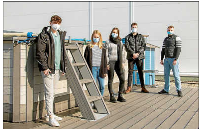
Ein Teil des Nachwuchses versammelt auf der Dachterrasse. Aktuell absolvieren acht wissbegierige junge Menschen ein Praktikum, eine Ausbildung oder ein Duales Studium bei der Chemoform AG.

/ Groß- und Außenhandel / E-Commerce), in der Lagerlogistik, der Produktion und der Mediengestaltung. Als Entwickler und Hersteller von Desinfektionsprodukten werden zudem Kompetenzen und Ressourcen genutzt, um der gesamtgesellschaftlichen Verantwortung nachzukommen und gebrauchsfertiges Flächen- und Händedesinfektionsmittel zur Inaktivierung von Corona-Viren in großen Mengen zu produzieren. Aktuell wird an der Eröffnung eines Ladengeschäfts am 2019 gebauten Hauptstandort auf dem ehemaligen Behr-Areal gearbeitet, damit die Wendlinger Bürger in Zukunft direkt