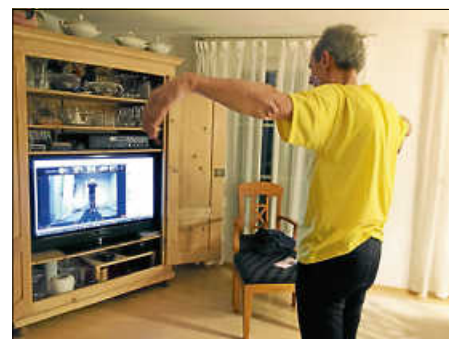
Online Sportangebot

Dieses Sportangebot wird für alle TVU-Mitglieder kostenfrei angeboten, selbstverständlich ist auch Schnuppern für Nichtmitglieder möglich.