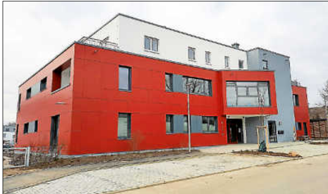
Das Gebäude fällt durch die rote Außenfassade bereits von Weitem auf.

Die Kinderkrippe für Kinder im Alter von 1 bis 3 Jahren befindet sich im Erdgeschoss. Neben den großzügigen Gruppenräumen sind dort auch ein Multifunktionsraum, den alle Gruppen beispielsweise für Bewegungsspiele oder Theateraufführungen nutzen können, sowie die Büroräumlichkeiten und weitere Nebenräume für das Personal zu finden. Im ersten Obergeschoss sind die beiden