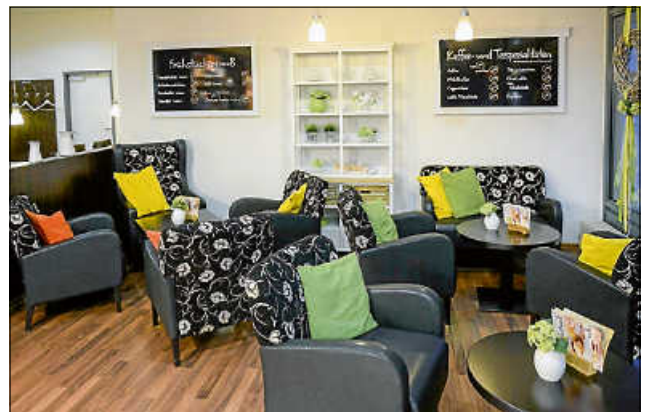
Frau Erb und Team freuen sich darauf, Sie schon bald wieder im Café-Bereich des Bäckerhaus Veit in der Unterboihinger Straße 26 begrüßen zu dürfen.

Wenngleich beim Bäckerhaus Veit in der Innenstadt auf den ersten Blick „business as usual“ vorzuherrschen scheint, hat sich für Filialleiterin Frau Erb doch einiges radikal verändert. Der weiträumige Cafébereich muss seit geraumer Zeit geschlossen bleiben: Ein angenehmes Schwätzen bei einer guten Tasse Kaffee vor Ort auf den ersten Blick also undenkbar.