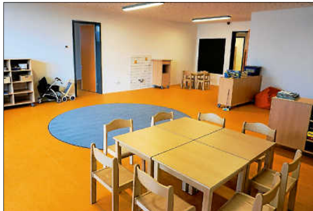
Die verschiedenen Gruppenräume sind großzügig und farbenfroh gestaltet.