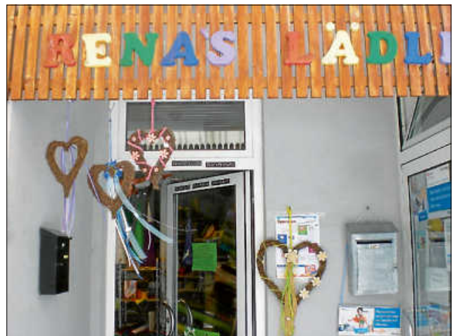
Bei Rena's Lädle in der Unterboihinger Straße 6 sind alle Kreativen und Bastelwilligen genau richtig.

Kontakt: Neuburgstraße 24, 73240 Wendlingen am Neckar Tel. 2847, Fax: 7761, E-Mail: info@stuckateur-jahn.de und per Web