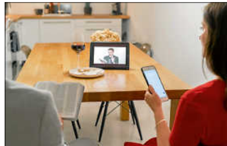
Gedenkgottesdienst per Videokonferenz