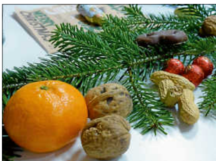
Schöne Weihnachten

Die AMSEL-Kontaktgruppe Wernau bedankt sich bei allen Freunden und Gönnern für die Unterstützung in diesem weiteren schwierigen Jahr. Geruhsame Weihnachten und die besten Wünsche für das kommende Jahr!