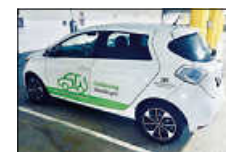
Zoe am Strom

Carsharing Wendlingen nimmt noch weitere Mitfahrer auf.