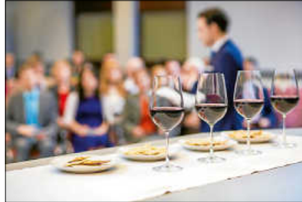
Gottesdienst am wichtigsten Feiertag von Jehovas Zeugen