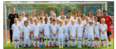
Unsere Teilnehmer beim Fußballcamp

Es ist die wohl größte und berühmteste Fußballschule der Welt. Die Fundación Real Madrid Clinic (FRMC) gastierte vom 5. bis 9.9. zum 3. Mal auf der Sportanlage Im Speck des TSV Wendlingen und veranstaltet ein Fußballcamp für Mädchen und Jungen zwischen sieben und 16 Jahren.