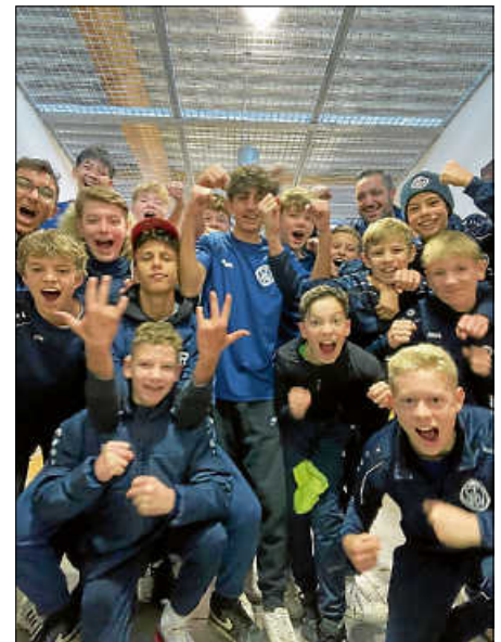
Unsere Jungs der C1

In der neu gegründeten Regionenstaffel, die seit dieser Saison die Bezirksstaffel ersetzt, konnten sich unsere C-Junioren mit einer konstant starken Leistung den Herbstmeistertitel sichern. Bevor in den nächsten Wochen die Vorbereitung für die Rückrunde startet, hieß es, sich an den vergangenen beiden Wochenenden auf dem Hallenparkett zu beweisen. Auch hier zeigten die Jungs eine überlegene Leistung und konnten sowohl das Turnier in Köngen als auch das Turnier in Gruibingen gewinnen! Herzlichen Glückwunsch an dieser Stelle und weiterhin viel Erfolg!