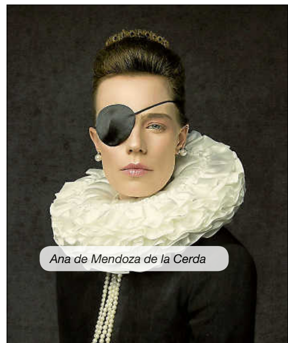
Ana de Mendoza de la Cerda