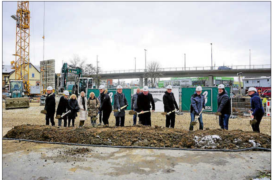
Der symbolische Spatenstich läutet die Baumaßnahmen ein.