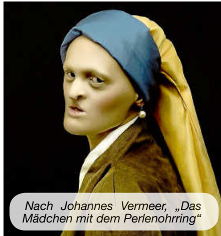
Nach Johannes Vermeer, „Das Mädchen mit dem Perlenohrring“

„In ihren fotografischen Arbeiten verleiht Sylwia Makris unterschiedlichen Menschen Sichtbarkeit, die zu der Entstehungszeit der malerischen Vorlagen nicht für bildwürdig erachtet wurden und setzt damit ein Zeichen für Inklusion. So wurde beispielsweise das sich heute im Louvre befindende Gemälde, Gabrielle d’Estrées und eine ihrer Schwestern für das Projekt mit einer Brustkrebspatientin nach ei-