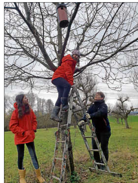
Jugendgruppe beim Nistkastenreinigen

Auch im Privatgarten und an Hauswänden können Nisthilfen angebracht werden. Gute Infos hierzu findet man auf der Homepage des NABU.