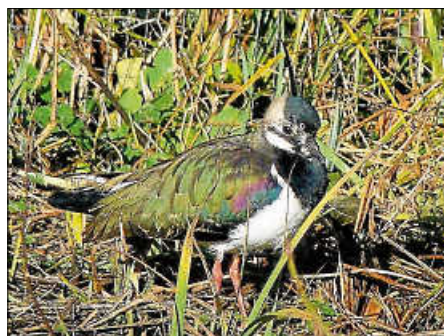
Kiebitz – Vogel des Jahres 2024

Auch in diesem Jahr freuen wir uns über neue Gesichter bei unseren Veranstaltungen. Wenn Sie uns unterstützen möchten oder einfach Interesse an unserer Arbeit haben, sind Sie herzlich eingeladen. Einen Überblick über unsere Veranstaltungen erhalten Sie auf der Homepage.