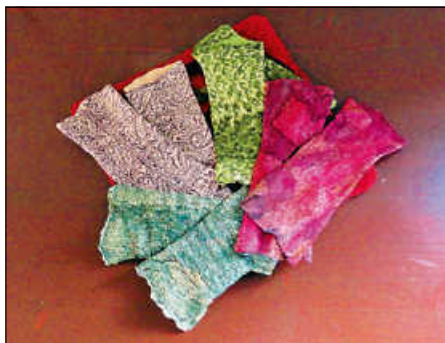
Armstulpen: Wolle auf Seide gefilzt

Armstulpen, Lampen oder Kissenhüllen können in Kombination mit Seide „verfilzt“ werden. Dünne Seide wird mit feinsten Merinowolle belegt. So entsteht beim Filzen eine ganz besondere Struktur. Sie können an diesem Abend feine Armstulpen, einen Schal oder einen Überzug für eine Lampe filzen. Seide und Lampen gibt es im Kurs oder Sie upcyclen Ihr altes Lieblingsseidentuch. Kursgebühr 11 € zzgl. Material. Dienstag, 6. Februar, 19 bis 21.30 Uhr, Raum 02/9, 2. OG. Anmeldung bei Kursleiterin Silke Heer, Tel. 53846.