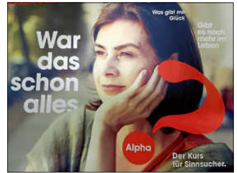
Grafik: Willkommen bei Alpha!

Wann? Start: 23.1. Jeweils dienstags um 20 Uhr Anmeldung unter office@centrumleben.de