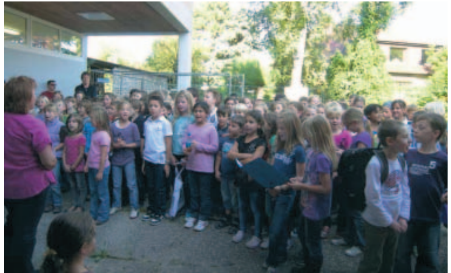
Die Schülerinnen und Schüler der 3. und 4. Klassen tragen mit einstudierten Baustellenliedern zur Grundsteinlegung bei.