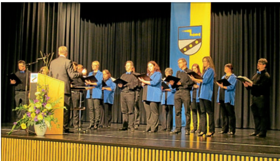
Der Gesangverein Eintracht Unterboihingen unterhielt die Gäste mit verschiedenen Gesangsstücken.

Gesangverein Eintracht Unterboihingen unter der Leitung von Helmut Grübel.