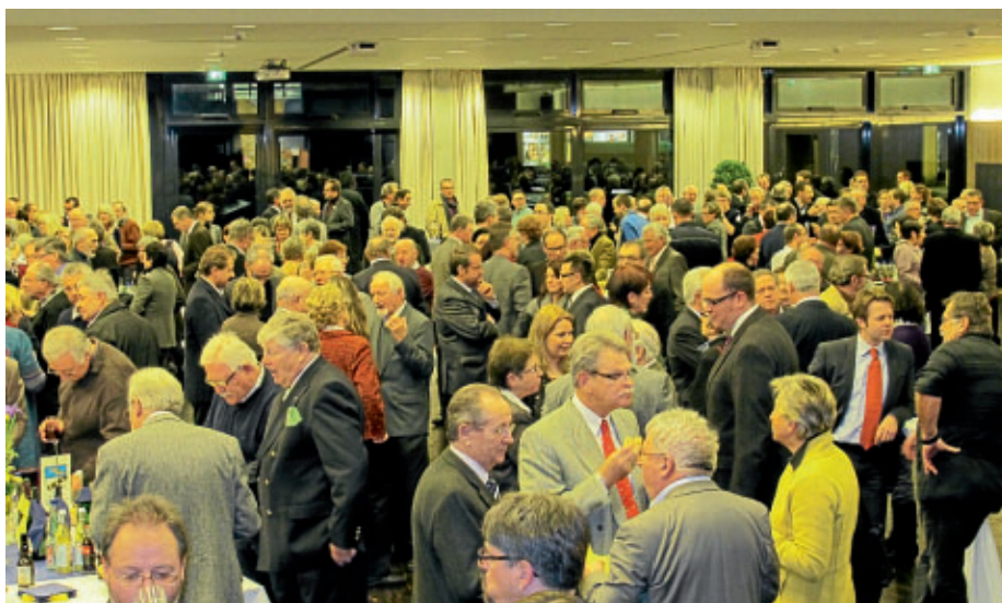
Die Gäste hatten die Gelegenheit in ungezwungener Atmosphäre miteinander ins Gespräch zu kommen und neue Kontakte zu knüpfen.

Aber auch in diesem Jahr dürfen wir uns auf eine Reihe von Jubiläen freuen. Am 16. und 17. Juni wird die Freiwillige Feuerwehr mit einem Festwochenende ihr 125-jähriges Bestehen feiern. Am 18. August folgt der 100. Geburtstag der Ortsgruppe Wendlingen des Schwäbischen Albvereins und vom 11.-14. Oktober geht das Zeltspektakel bereits zum 30. Mal über die Bühne. Merken Sie sich diese Termine vor, die Jubilare freuen sich sicherlich über einen Besuch von Ihnen.