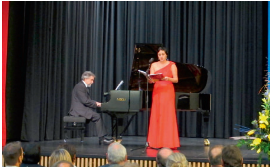
Die Musikschule Köngen/Wendlingen unterhält das Publikum mit ausgewählten Stücken.