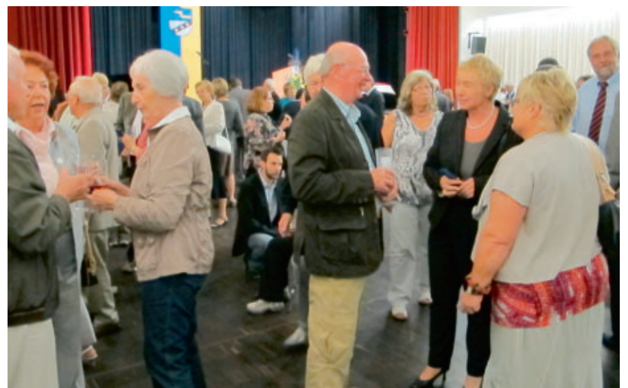
Im Anschluss an den offiziellen Teil der Vereidigung und Verpflichtung des Bürgermeisters können die Gäste den Abend beim Stehempfang ausklingen lassen und sich untereinander austauschen.