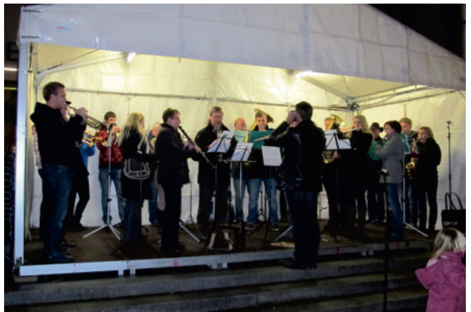
Auftritte von der Musikschule, den Vereinen und Kirchen umrahmten den Markt stimmungsvoll (hier: Musikverein Wendlingen).