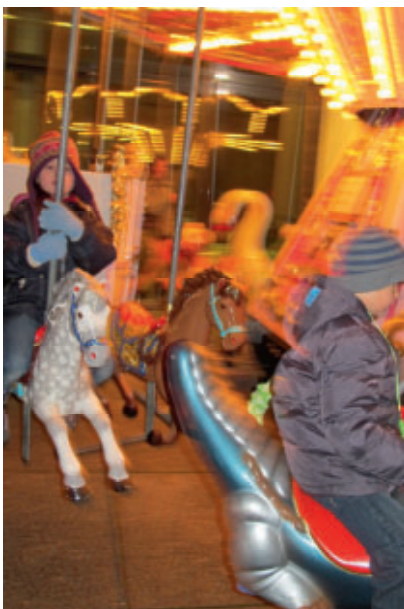
Auch das nostalgische Karussell drehte wieder seine Runden.