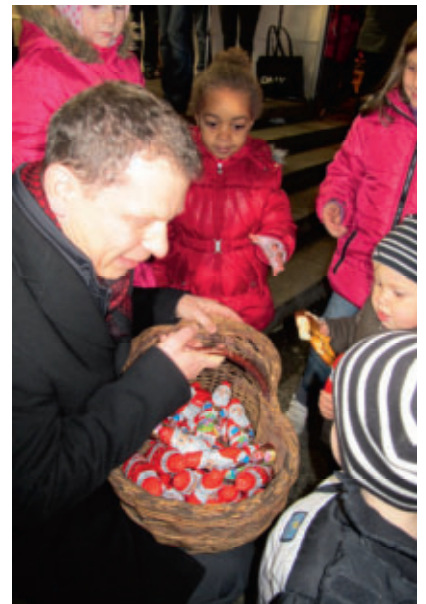
Für die Kleinen gab es leckere Schokolokoläuse.