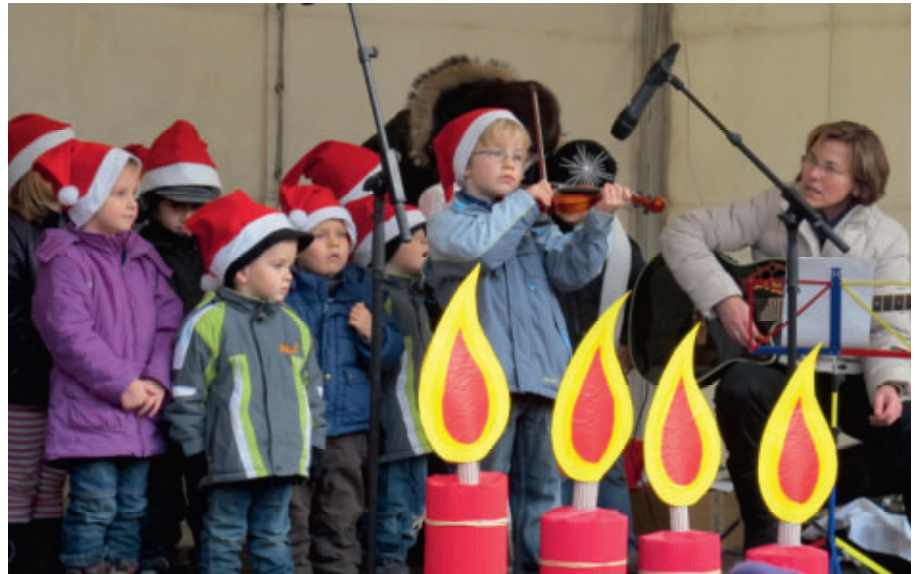
Bereits am Donnerstagnachmittag stimmten die Kinder des Kindergarten Bismarckstraße mit weihnachtlichen Liedern auf den Weihnachtsmarkt ein.