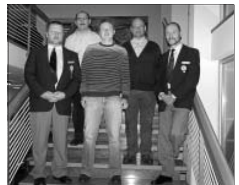
Die geehrten Blutspenderinnen und Blutspender.