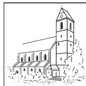
Katholische Kirchengemeinde St. Kolomban.