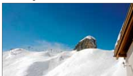
Traum Panorama bei Traum Wetter!

Fazit: Ein idealer Tag für alle, die es in der Partyhochburg so richtig krachen lassen, aber das Skifahren nicht vernachlässigen wollen.