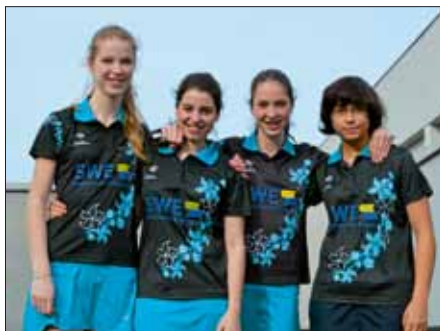
U18 Mädchen TSV Wendlingen.

Spitzenspielsieg: Unsere U18 Mädchen sind am Ziel ihrer Träume angelangt und feiern überlegen die Landesligameisterschaft und gleichzeitig den Aufstieg in die Verbandsklasse Mädchen U18. Das bedeutet die 3. Meisterschaft in Folge! Wahnsinn!