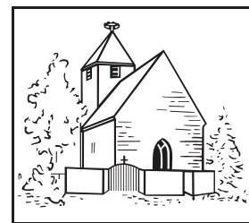
Evangelische Kirchengemeinde Bodelshofen.

18.30 Uhr Junge Kantorei, Freitagsschor– Eusebiuskirche.