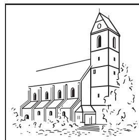
Katholische Kirchengemeinde St. Koloman.