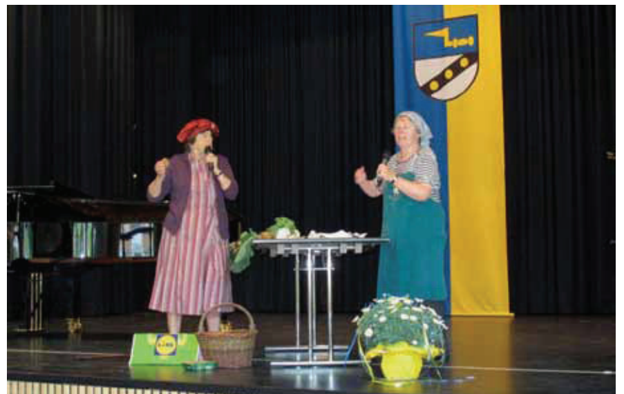
Das „Chörle“ vom Katholischen Frauenbund spielt lustige Szenen vom Wendlinger Wochenmarkt und bringt die Zuschauer zum Lachen.