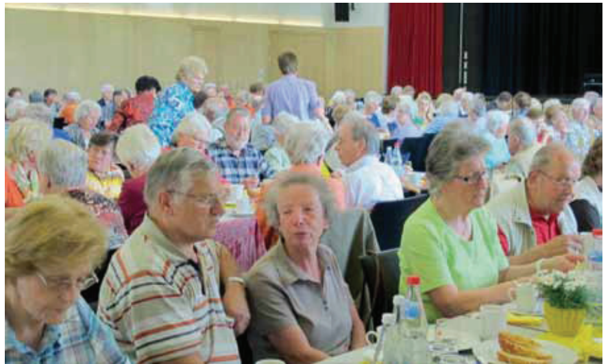
Ca. 300 Seniorinnen und Senioren folgen wieder der Einladung zum Städtischen Seniorenachmittag im Treffpunkt Stadtmitte.