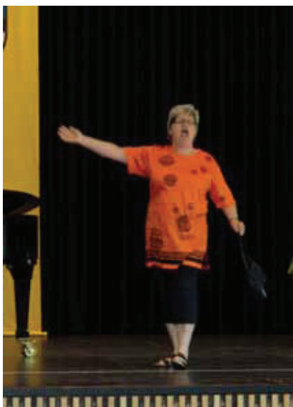
„Trude Herr“ schaut als Überraschungsgast vorbei und singt ihren Klassiker „Ich will keine Schokolade“.