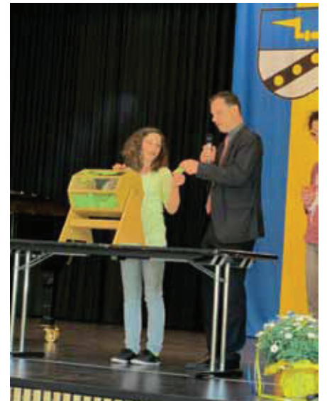
Auch in diesem Jahr sorgt Glücksfee Maja für fröhliche Gewinner.