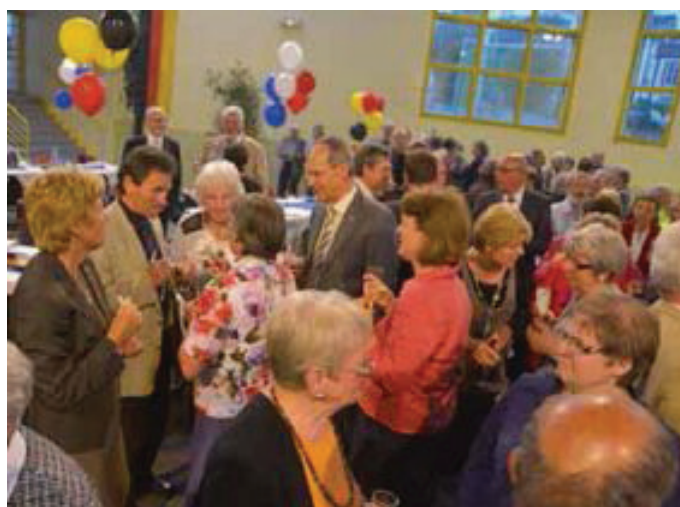
Ausgelassene Stimmung beim Festabend.