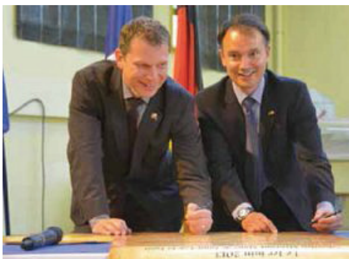
Die beiden Bürgermeister bei der Unterzeichnung der Freundschaftsurkunde.