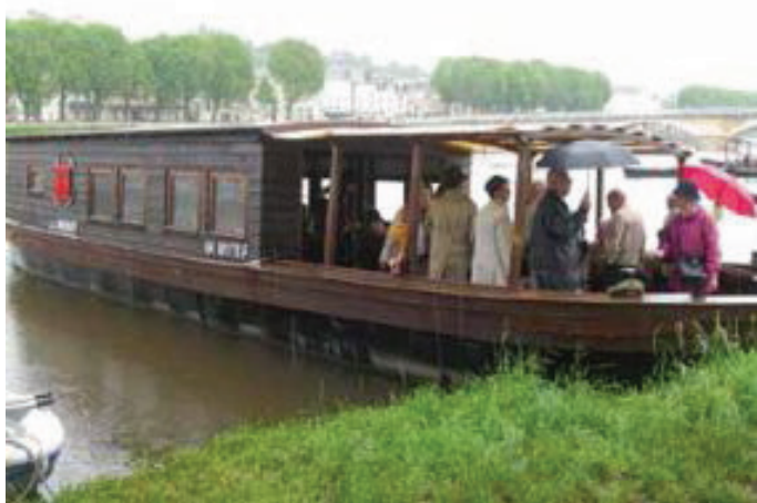
Bootsfahrt auf der Vienne.