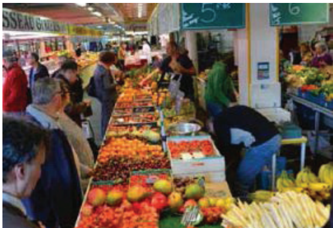
Markthalle in Saint-Leu-la-Forêt.