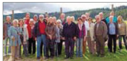
BMW Club auf der Straußenfarm

Fotos dieser Clubausfahrt können sich unsere Mitglieder und auch Gäste gerne im Internet auf unserer Clubseite ansehen: www.bmwclub-neckar-fils.de