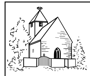
Evangelische Kirchengemeinde Bodelshofen