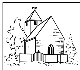
Evangelische Kirchengemeinde Bodelshofen