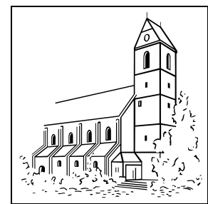
Katholische Kirchengemeinde St. Kolumban