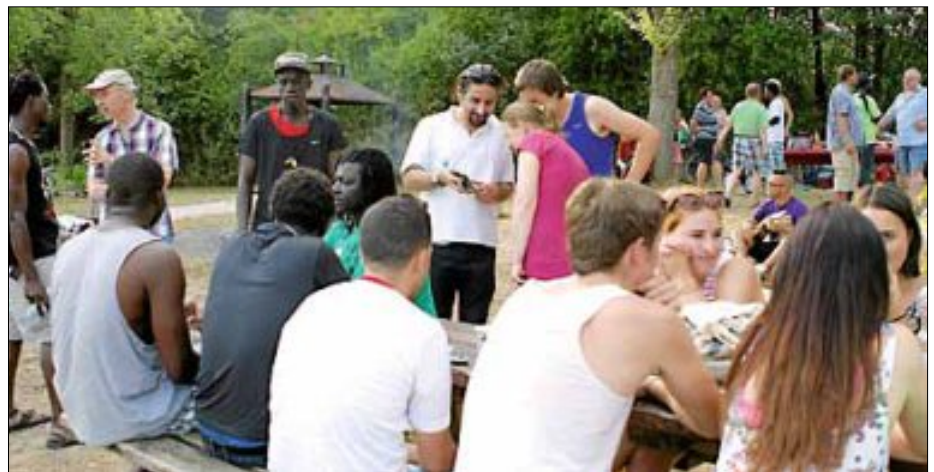
Am ersten Augustwochenende organisierte der AK Asyl ein wunderschönes Grillfest.

Neben den mitgebrachten Speisen und Getränken sorgten Spiele, gute Gespräche und Musik für einen fröhlichen Abend. Die Firma Sport Ráppe stellte extra eine Torwand zur Verfügung, damit 20 gespendete T-Shirts auf sportliche Art einen neuen Besitzer finden konnten.