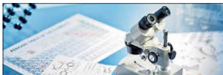
Wissenschaft und Bibel